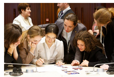
Corelează imaginile cu evenimentele și personalitățile corespunzătoare