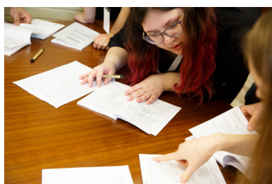
Răspunde la întrebări reieșind din articolele Constituției Republicii Moldova