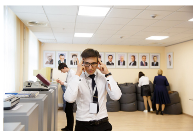
Răspunde la întrebări în baza vizitei la muzeul Parlamentului