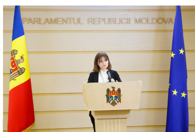
Realizează o conferință de presă